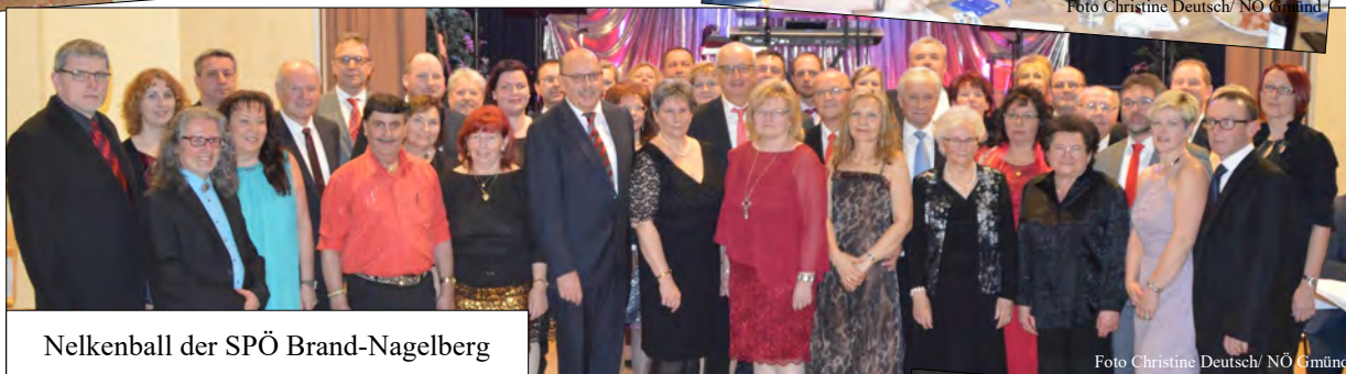
Nelkenball der SPÖ Brand-Nägelberg