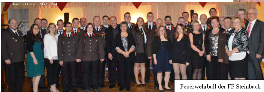
Feuerwehrball der FF Steinbach