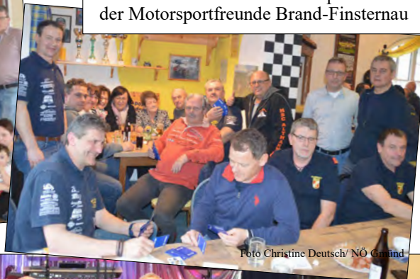
Bschoad-Binkerl-Schnapsen der Motorsportfreunde Brand-Finsternau