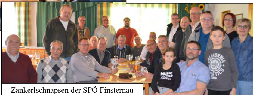
Zankerlschnapsen der SPÖ Finsternau