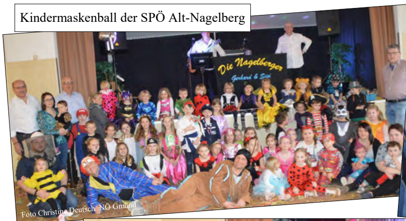
Kindermaskenball der SPÖ Alt-Nägelberg